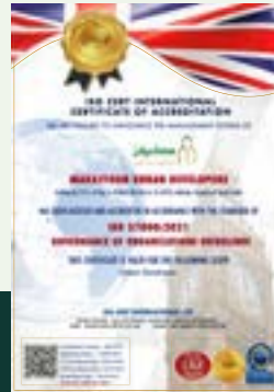
شهادة الايزو لحوكمة المنظمات ISO Governance of Organizations Guidlined