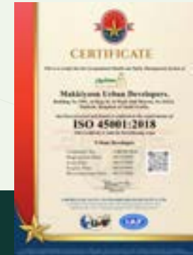
شهادة الايزو في الصحة والسلامة المهنية ISO Certification in Health and Safety Management System