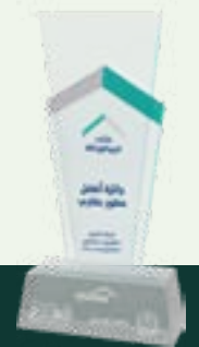
أفضل مطور عقاري Best Real Estate Developer