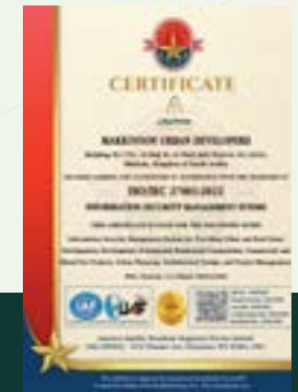
شهادة الايزو في أمن المعلومات ISO Certification in Information Security Management System