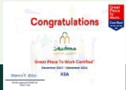
أفضل بيئة عمل Best working environment