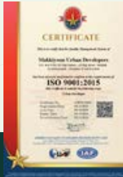
شهادة الايزو في نظام إدارة الجودة ISO Certification in Quality Management System