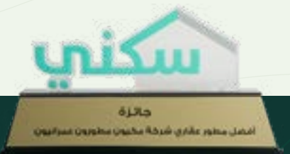
أفضل مطور عقاري Best Real Estate Developer