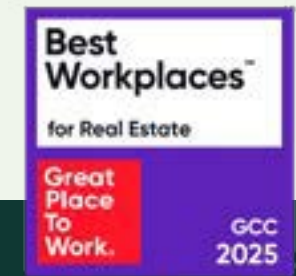
أفضل بيئة عمل في التطوير العقاري Best working environment