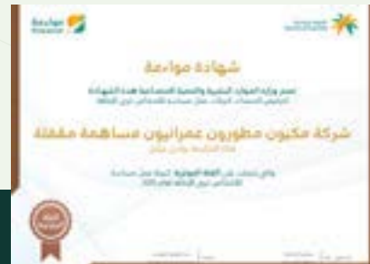
شهادة مواعمة Muaama certificate