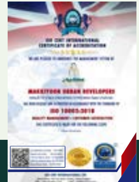
شهادة الايزو في إدارة شكاوى العملاء ISO Certification in Quality Management of Customer Satisfaction