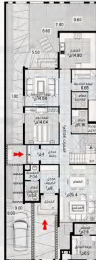
الدور الارضي 155 م ٢