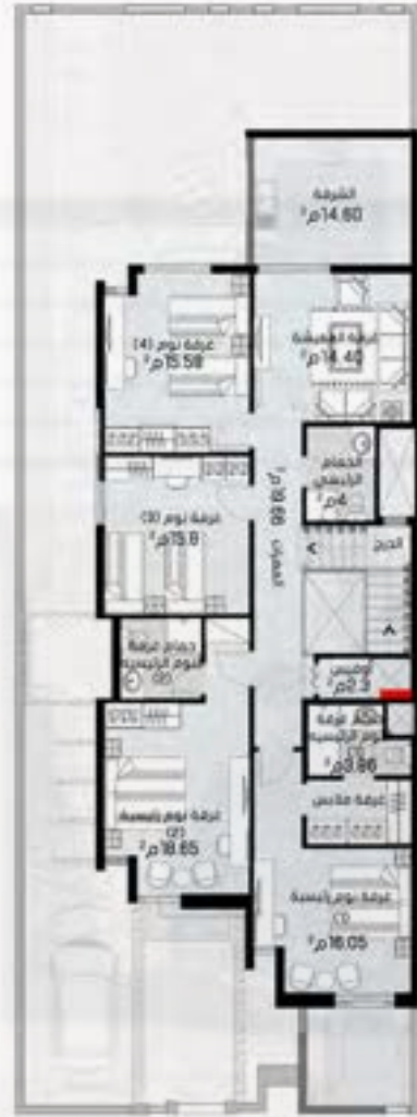
الدور الأول 128 م ٢